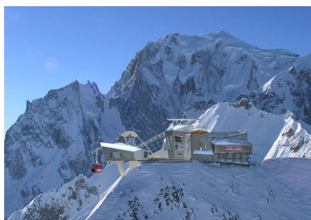
stazione di monte - fotosimulazione