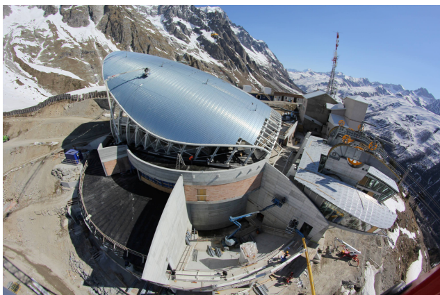
stazione di valle - cantiere

PERIODO DI SVOLGIMENTO DEL SERVIZIO: 2006-2007