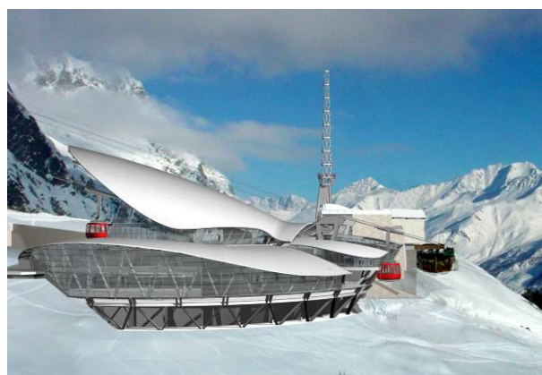
stazione di valle – fotosimulazione