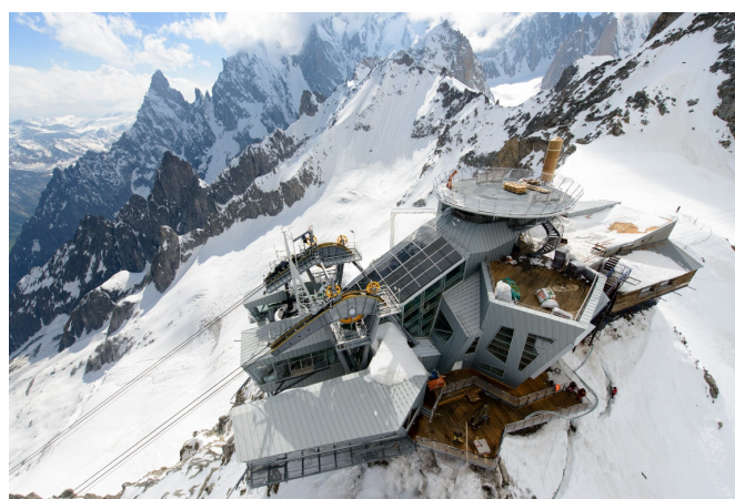
stazione di monte