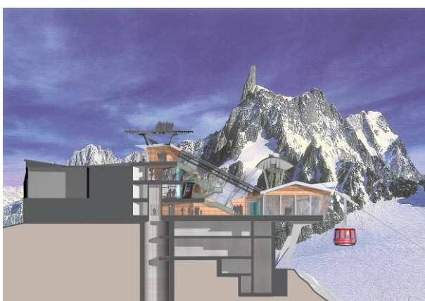
stazione di monte – sezione modello con pozzo