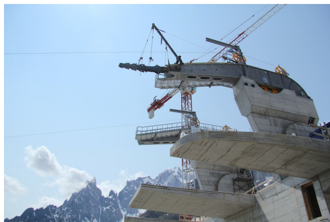
stazione di monte – cantiere