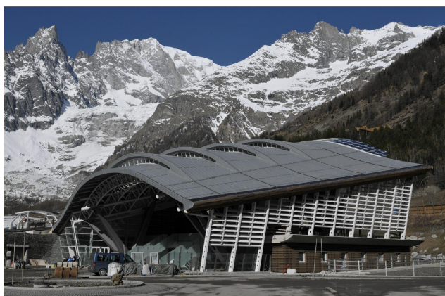
stazione di valle - cantiere

PERIODO DI SVOLGIMENTO DEL SERVIZIO: 2006-2007