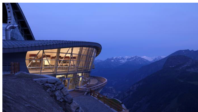
stazione di monte