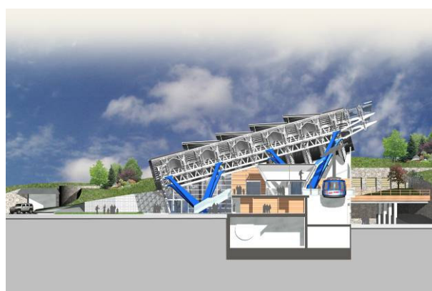
stazione di valle – sezione modello