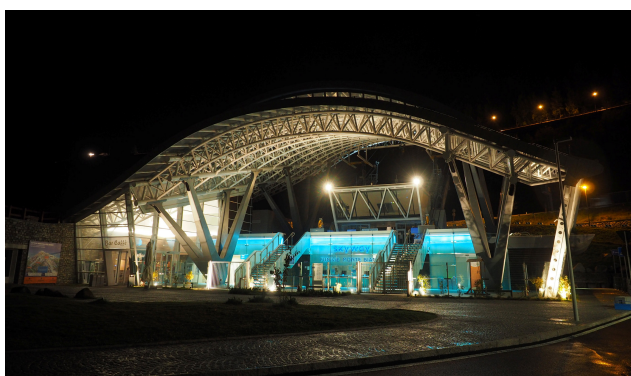
stazione di valle