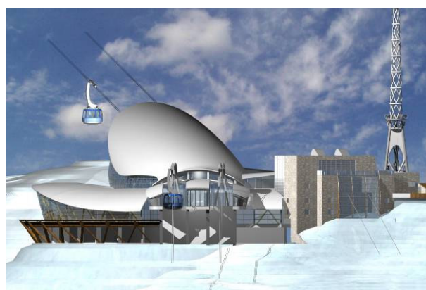
stazione di monte - fotosimulazione