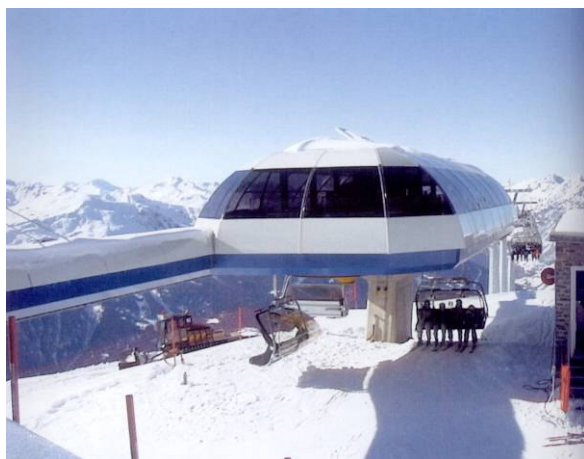
stazione di monte

PERIODO DI SVOLGIMENTO DEL SERVIZIO: 1999