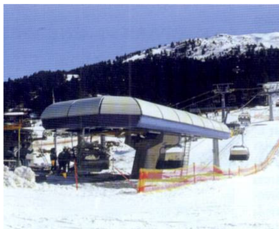
stazione di valle