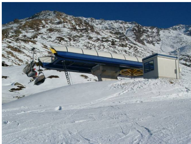
stazione di monte