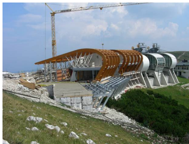
cantiere – vista da nord