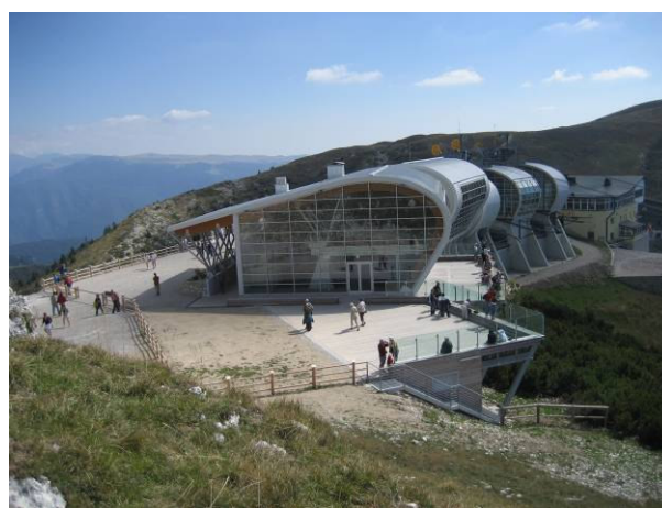
opera finita – vista da nord