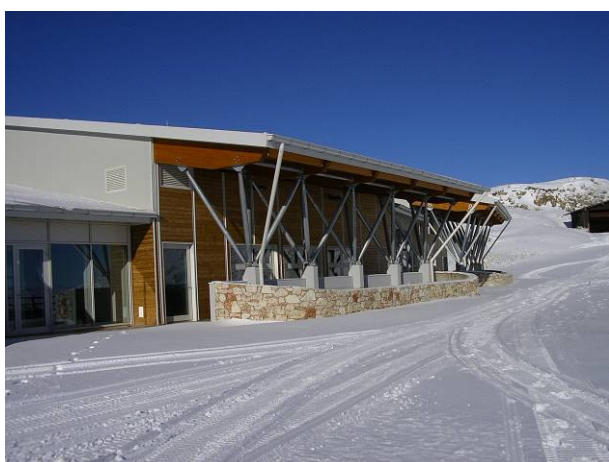
opera finita – vista da est