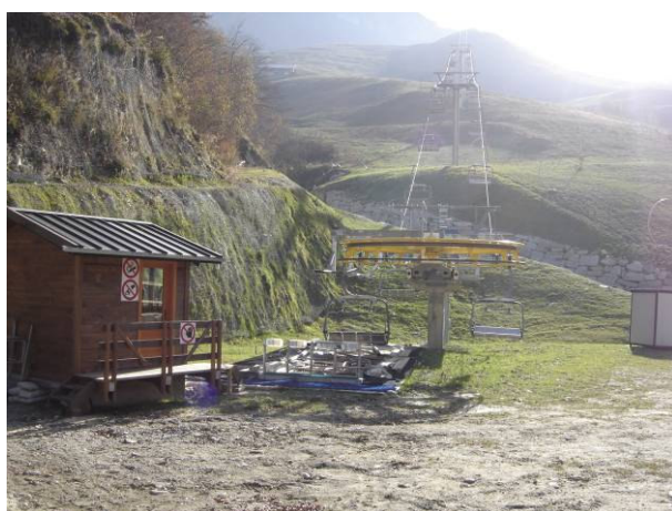
stazione di valle