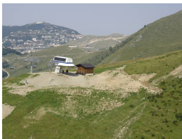
stazione di monte