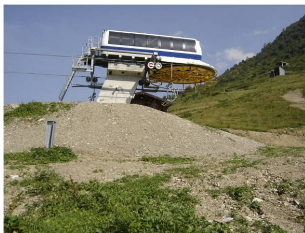
stazione di monte