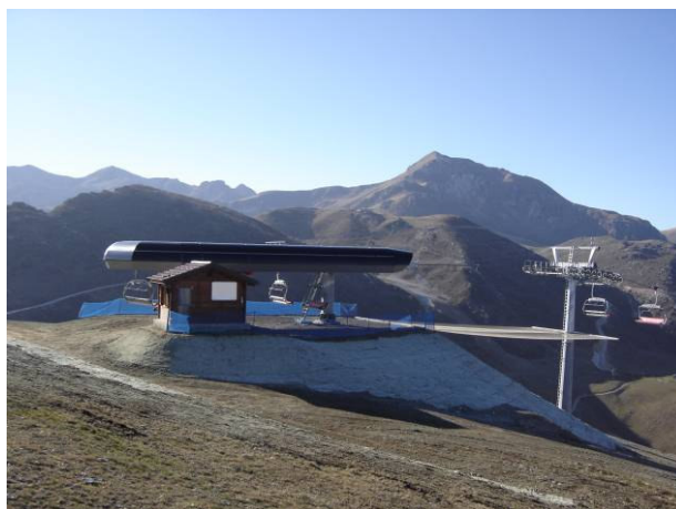
stazione di monte