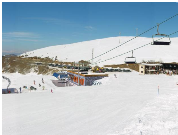
fotomontaggio stazione di valle