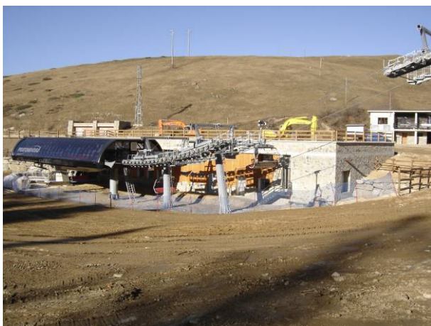
stazione di valle

PERIODO DI SVOLGIMENTO DEL SERVIZIO: 2005 - 2007