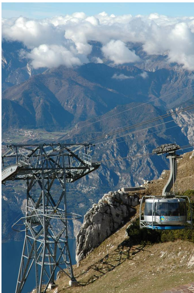
vettura con cabina rotante e portata di 80 persone + vetturino

PERIODO DI SVOLGIMENTO DEL SERVIZIO: 1999 - 2002