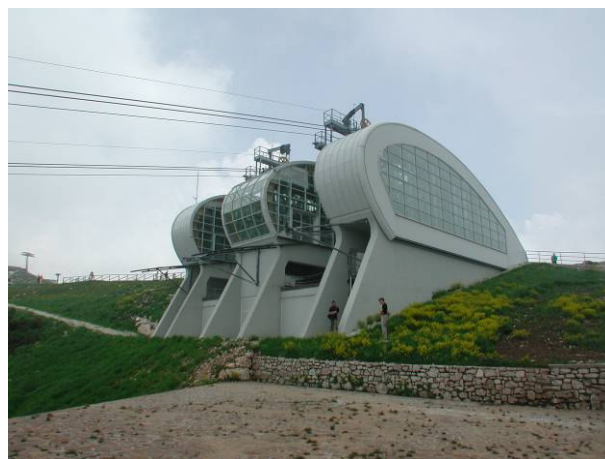
stazione di monte