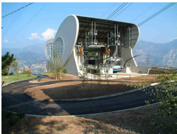
stazione di valle

PERIODO DI SVOLGIMENTO DEL SERVIZIO: 1999 - 2002